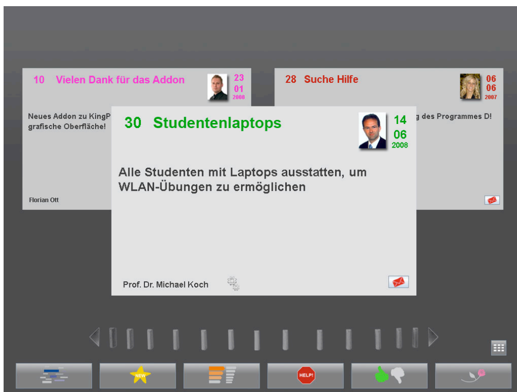
Abbildung 1: Standard-Darstellung von Elementen im Idea Mirror

Die in Abbildung 1 gezeigte Kartendarstellung dient aufgrund ihrer Größe hauptsächlich der Gewährleistung ausreichender Wahrnehmungsmöglichkeiten in der Ambient- und Notification Zone.